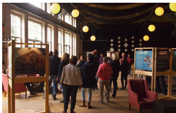
Führung und Ausstellung zum Kühlhaus und seiner Geschichte