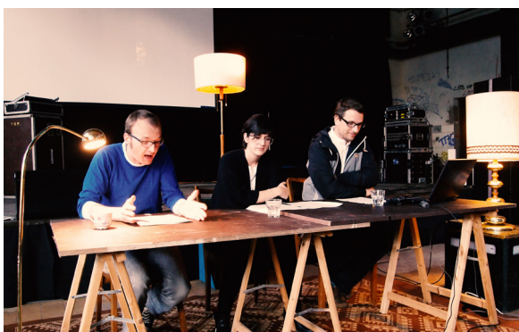
Lesung mit der Theatergruppe Trockendock