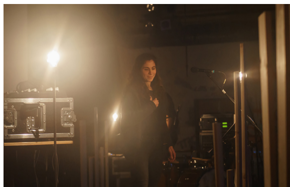
Die Maschinenhalle wurde auch visuell in Szene gesetzt.